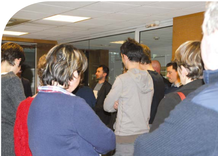
Le personnel à l'écoute du Président

Un apéritif, autour duquel de nombreux échanges ont eu lieu est venu clôturer cette cérémonie.